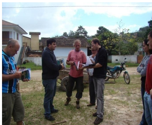
Mutirão de distribuição de cartilhas nas comunidades.

O projeto foi realizado em etapas. A primeira consistiu num esforço de sensibilização para a difusão da ideia (mutirão de cartilhas, reuniões comunitárias, etc.) e a constituição do Grupo Organizador (Comissão Provisória). A segunda etapa procurou aprofundar a mobilização social por meio de oficinas e visitas a cooperativas de crédito em funcionamento.