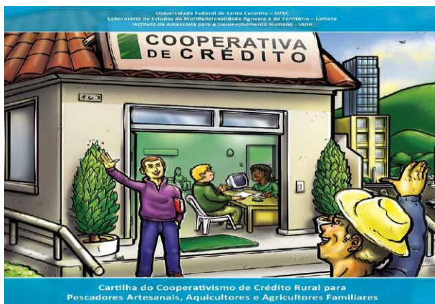
Capa da Cartilha do Cooperativismo de Crédito Rural para Pescadores Artesanais e Agricultores Familiares.

O projeto “Promoção do Cooperativismo de Crédito junto a Pescadores e Aquicultores Familiares” pretende melhorar a vida financeira, a cooperação e o desenvolvimento territorial da regiões litorâneas de Santa Catarina. Coordenado pela UFSC, Escritório Local da Epagri e Prefeitura, desde março de 2010 o projeto vêm mobilizando pescadores artesanais, agricultores familiares, autoridades, técnicos e lideranças visando a criação de uma cooperativa de crédito solidária na região de Garopaba.