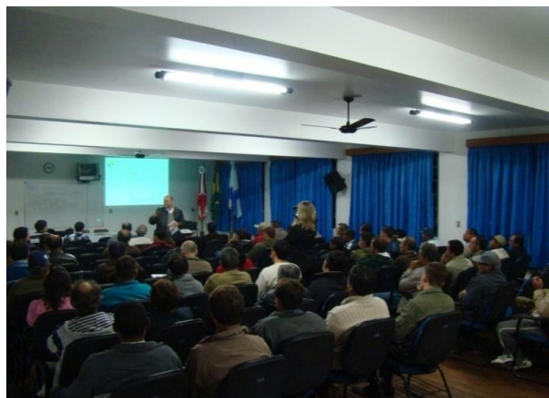
Reunião comunitária em Garopaba. Para explicar as vantagens e obrigações de uma cooperativa foram realizadas dezenas de eventos.

A terceira e última etapa do projeto consiste em apoiar a inauguração da sede da Cooperativa e reforçar o divulgação nas comunidades do território que serão atendidas. O objetivo agora é esclarecer um pouco mais sobre os benefícios de ser cooperado e como a cooperativa pode ajudar no desenvolvimento da região.