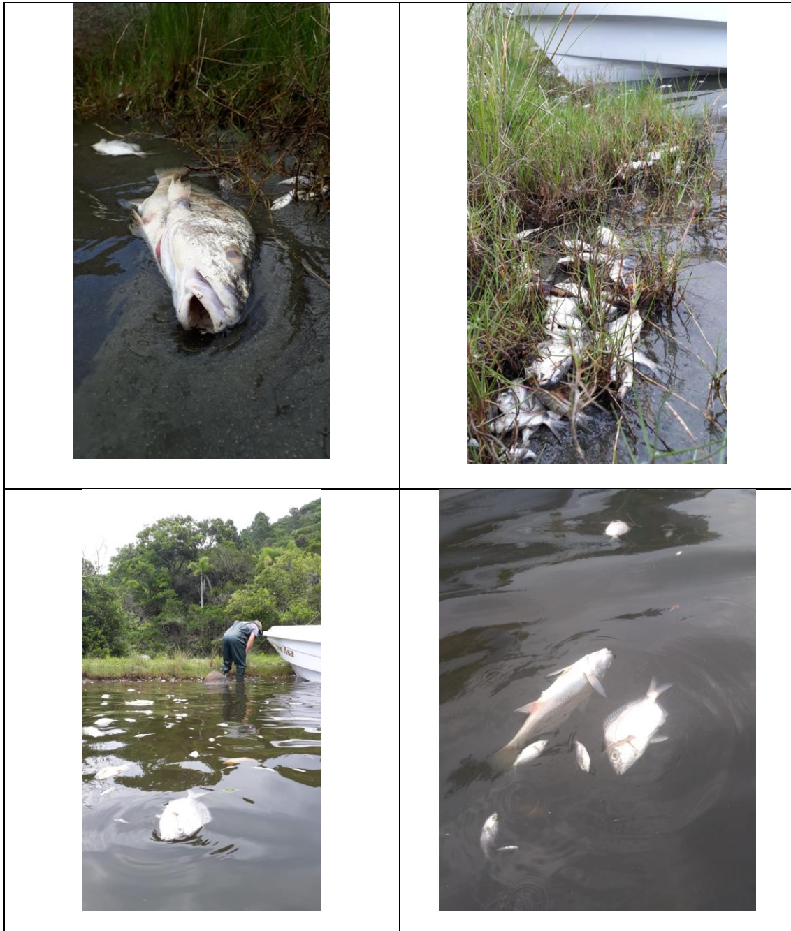
Figura 1. Imagens da mortandade de organismos na Lagoa da Conceição.